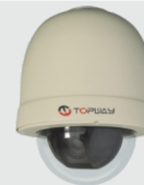
FOCUS SPEED (HD-SDI)